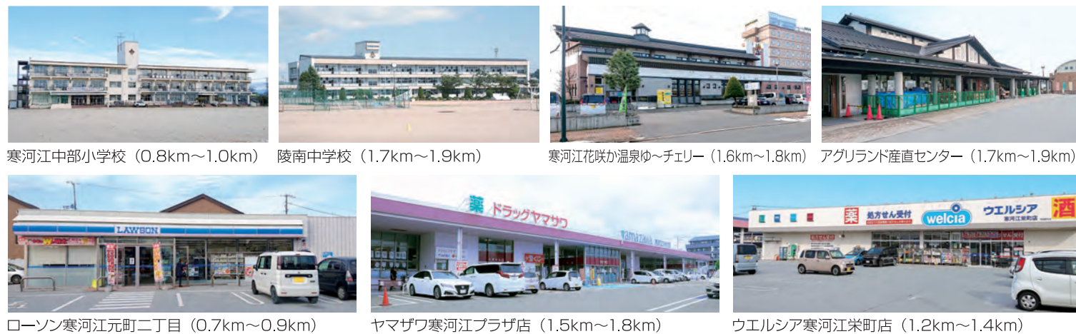
寒河江中部小学校 (0.8km~1.0km) 陵南中学校 (1.7km~1.9km) 寒河江花咲か温泉ゆ〜チェリー (1.6km~1.8km) アグリランド産直センター (1.7km~1.9km) ローソン寒河江元町二丁目 (0.7km~0.9km) ヤマザワ寒河江プラザ店 (1.5km~1.8km) ウエルシア寒河江栄町店 (1.2km~1.4km)